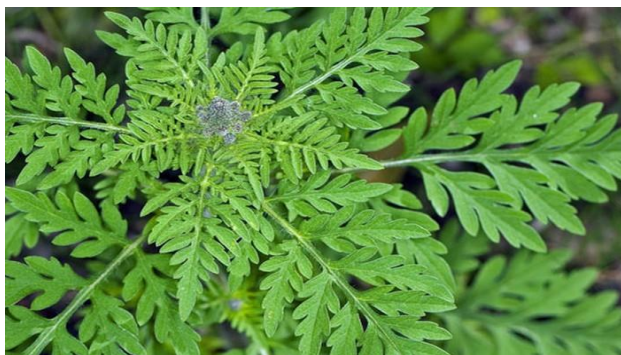
Travanj do lipanj – biljka pogodna za pljevidbu