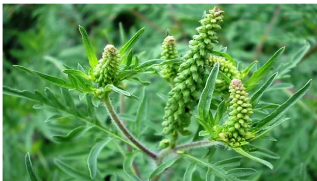
Lipanj do srpanj – biljka prije cvjetanja