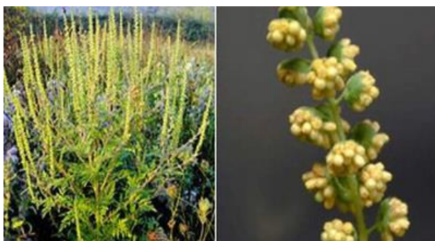
Srpanj do rujan – biljka u cvjetanju